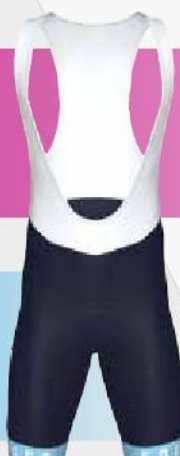
NON-PRINT/ FULL DYED